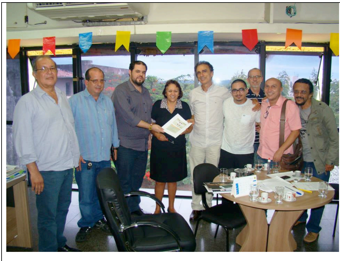
Reunião Com Secretário de cultura de Natal RN